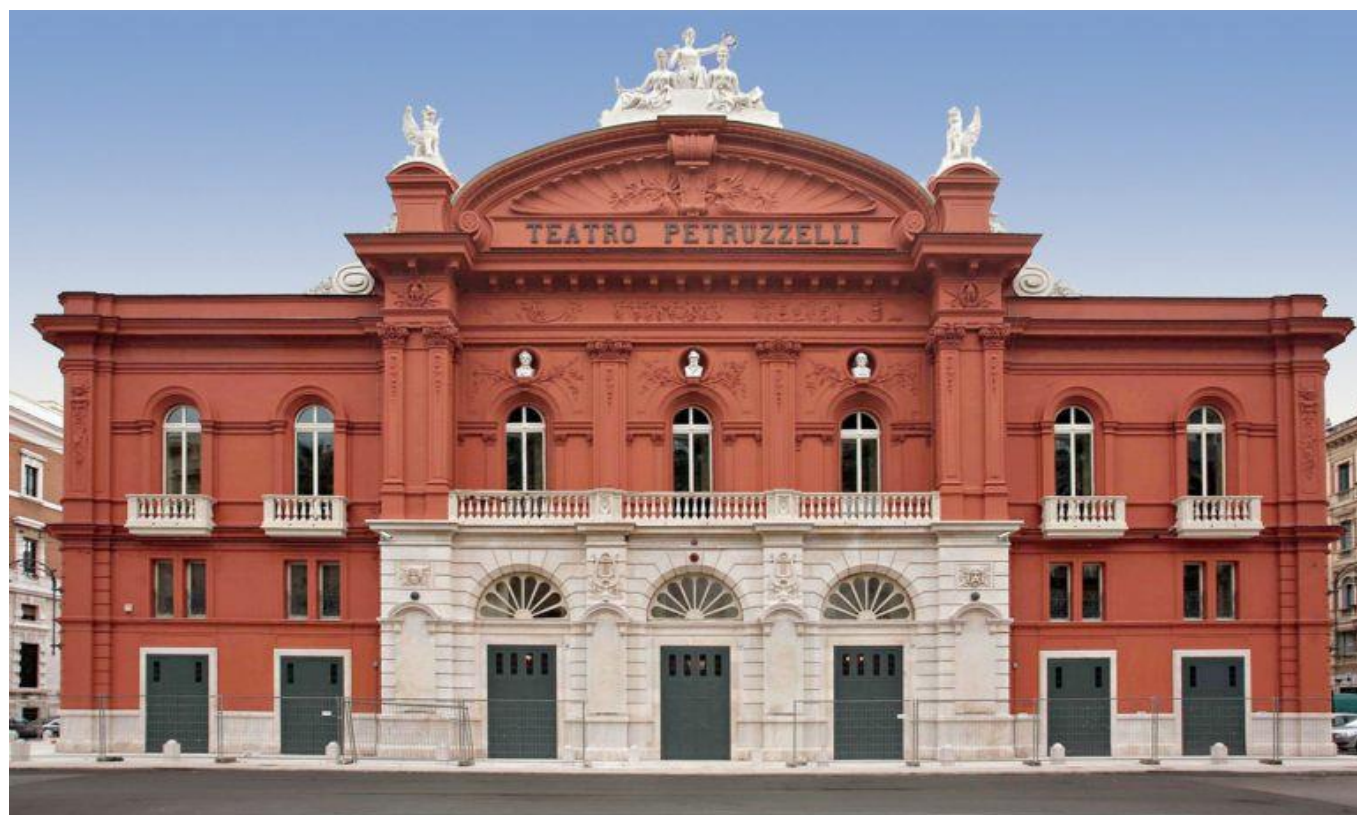
Bari, Teatro Petruzzelli

N.B. Il programma potrà subire variazioni e sarà effettuato solo al raggiungimento di un numero minimo di partecipanti.