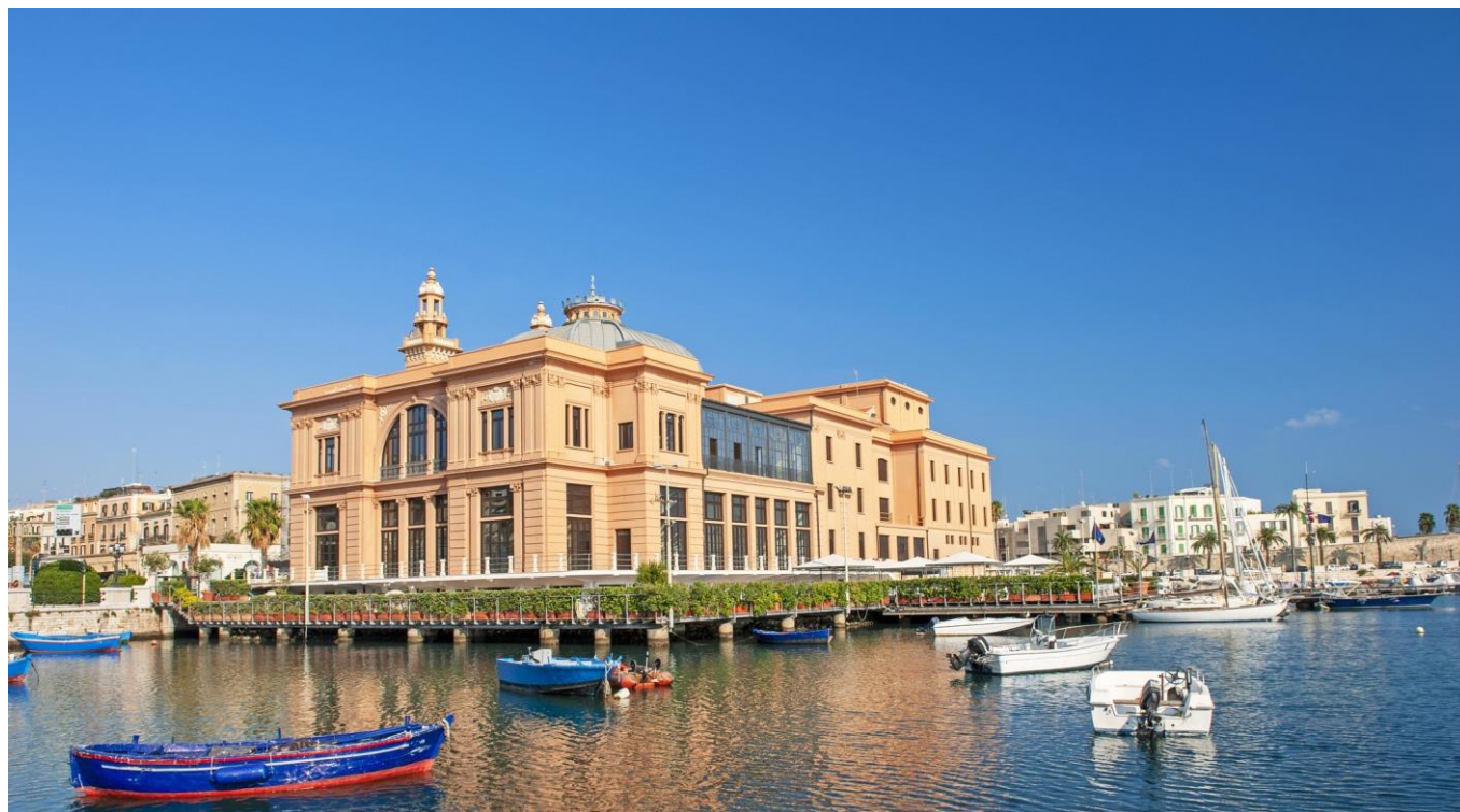
Bari, Teatro Margherita

Orario da definire - Passeggiata (o visita guidata) nel Centro storico di Bari o Palazzo dell’Acquedotto Pugliese