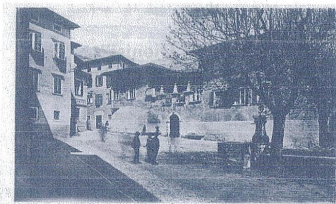
VILLA LAGARINA. Piazza Riolfatti. Palazzo Marzani

Palazzo Priami Madernini Marzani Villa Lagarina (Tn) Piazza Giovanni Battista Riolfatti 18