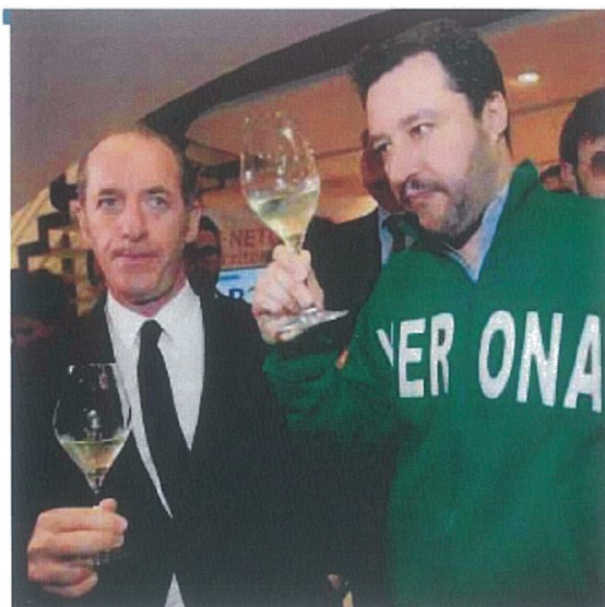
Luca Zaia e Matteo Salvini ieri a Vinitaly