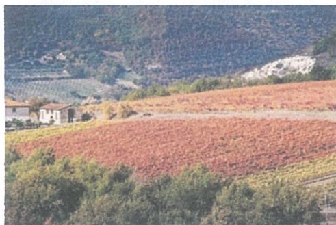
Vigneti della tenuta Bossi dei Marchesi Gondi (Toscana).

L'ADSI (Associazione Dimore Storiche Italiane) torna a Vinitaly dal 22 al 25 Marzo 2015 a Verona, sottolineando ancora una volta l'impegno dei proprietari di dimore storiche, oggi fedeli custodi di un patrimonio storico/artistico che è parte essenziale dell'identità culturale del