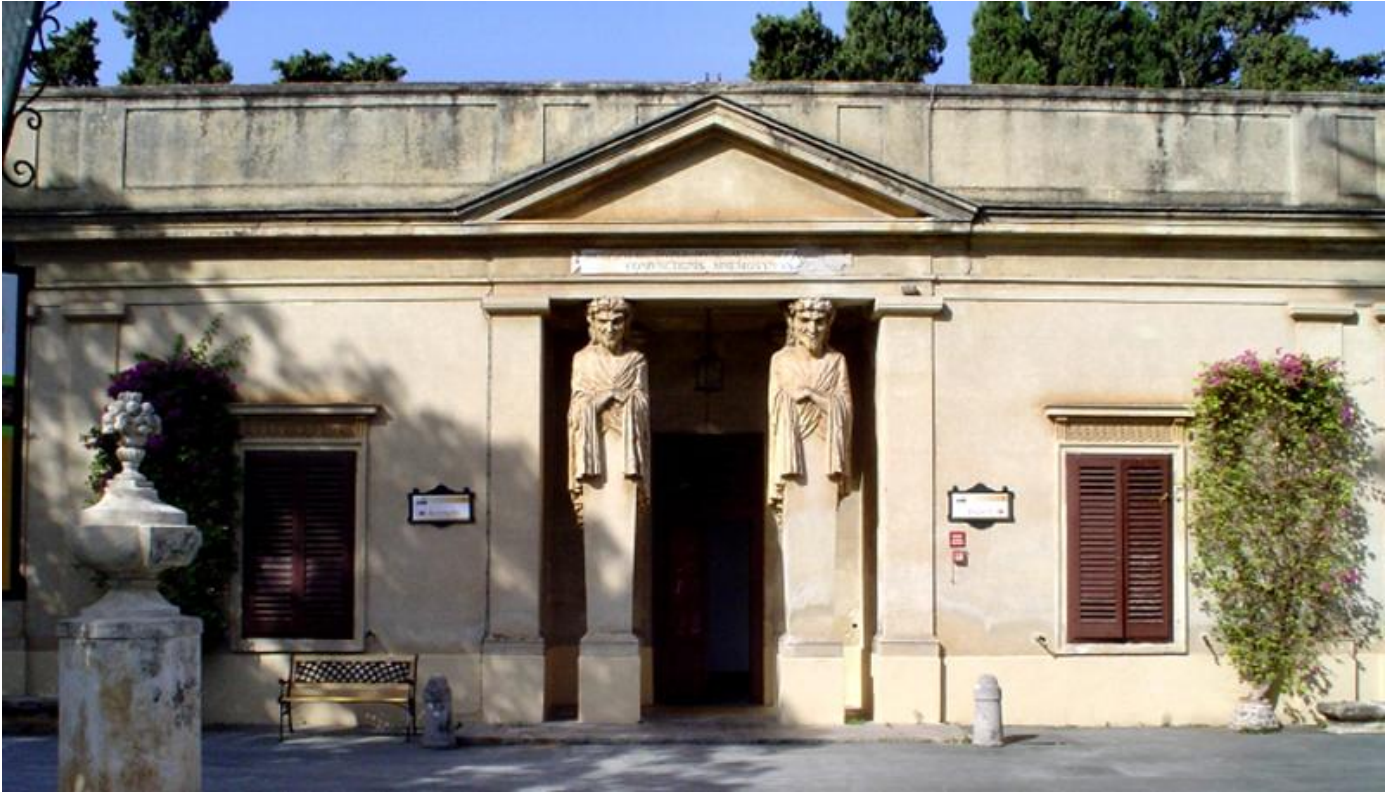
L'ingresso del Teatro di Verdura