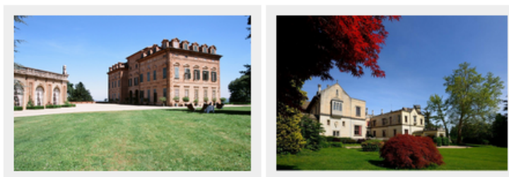
Castello di San Martino Alfieri (a sin) e Castello Dal Pozzo (a ds)

La 5° edizione delle Giornate Nazionali dell'Associazione delle Dimore Storiche Italiane (A.D.S.I.), il 23 e 24 maggio 2015, aprirà 18 residenze storiche private, sparse tra le Province di Alessandria, Asti, Biella, Novara e Torino. L'obiettivo è non solo aprire queste dimore, solitamente chiuse al pubblico, ma di accompagnare l'apertura con mostre, degustazioni e attività culturali. A ispirare questa scelta, ovviamente la vicina Expo di Milano , che invita a riflettere sul cibo, anche come prodotto culturale: molte dimore storiche sono al centro di proprietà terriere e per questo la loro apertura intende far conoscere non solo il loro valore storico-architettonico, ma valorizzare anche le produzioni agroalimentari d'eccellenza.