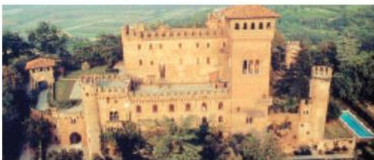
Il Castello di Gabiano

Sono tanti i luoghi da visitare in tutta Italia (oltre duecento in totale), tre quelli in provincia di Alessandria: c'è il Castello di Gabiano (in via San Defendente), dove sarà possibile visitare le sale principali, le cantine storiche e il parco dove si trova anche un particolare labirinto-giardino (due i turni di visita al