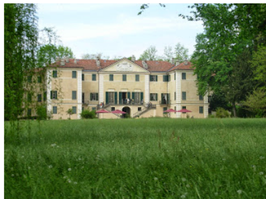
Villa Il Passatempo_Chieri_Torino

Il 23 e 24 maggio 2015 saranno visitabili sei residenze private in provincia di Torino. È programmata per sabato 23 e domenica 24 maggio 2015 la quinta edizione delle "Giornate Nazionali A.D.S.I.", l'iniziativa annuale dell'Associazione