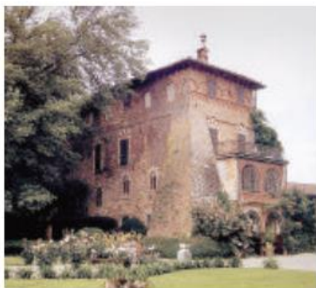
● Castello di Marchierù a Villafranca

S NOEMIPENNA ono sei le dimore storiche della provincia di Torino che sabato 23 e domenica 24 apriranno straordinariamente al pubblico per la quinta edizione delle «Giornate Nazionali Adsi». In molti casi la visita sarà guidata dagli stessi proprietari di casa, che illustreranno gli usi residenziali delle stanze più antiche, ma anche i reperti storici e le opere artistiche custodite. E alcune residenze proporranno anche degustazioni di vini locali e prodotti tipici, unendo al tour un'esperienza in sinergia con l'Expo di Milano.