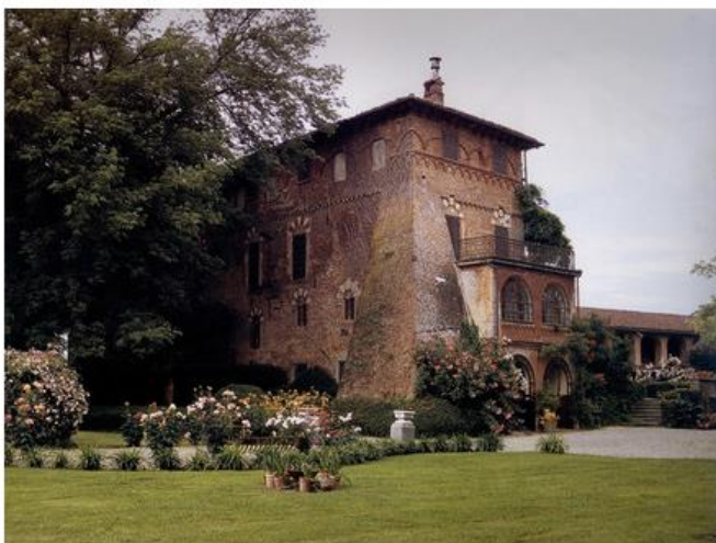
Castello di Marchierù_Torino

visitabili sei residenze private in provincia di Torino