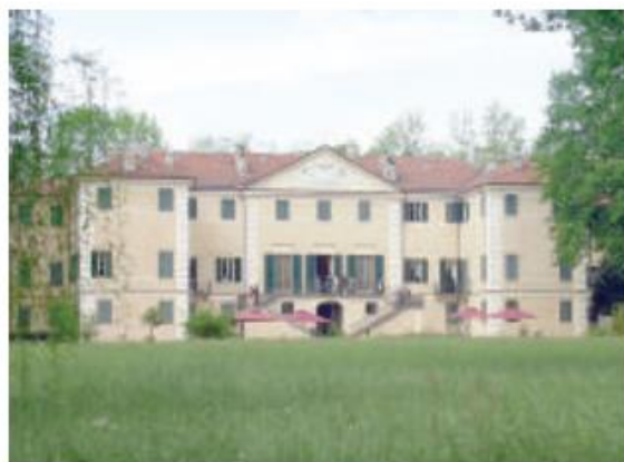
● Villa il Passatempo delle Dame di Verrua a Chieri

Aderiscono il Castello Sansalvà di Santena (via Sansalvà 62, aperto sabato 23 dalle 10 alle 15, su prenotazione allo 011/51.72.240), opera dell'architetto e paesaggista di corte Xavier Kurten, e Casa