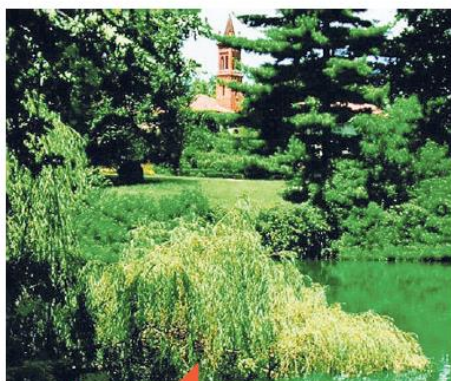
SANTENA E VILLAFRANCA PIEMONTE Il Castello di San Salvà, con il parco storico e le cascate. A destra, il Castello di Marchieru, a Villafranca