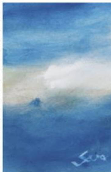
UN'OPERA DI SARA VERGANO

Anche nell'Astigiano si aprono al pubblico i palazzi più affascinanti e ricchi di storia, in occasione delle giornate delle Dimore Storiche Italiane. Sabato e domenica in tutto il Piemonte saranno coinvolti 18 palazzi e castelli, di cui 4 nella nostra provincia: aderiranno all'iniziativa Palazzo Gazelli che, situato nel centro storico di Asti, aprirà al pubblico il suo ampio cortile interno e le cantine storiche (quattro turni di visita alle 10, 11, 16 e 17; prenotazioni a info@palazzogazelli.it o 348 7152273); il Castello di Passerano, nel comune di Passerano Marmorito, di cui saranno visitabili le sale medievali (solo domenica, dalle 11 alle 13 e dalle 15 alle 18, prenotazioni a piemonte@adsi.it o al 011 8129495); il Castello di Robella, in cui si potrà effettuare un tour del parco storico e di tutti gli esterni (solo domenica dalle 10.30 alle 19, prenotazioni a monferrato30@gmail.com ), e infine il Castello di San Martino Alfieri che offrirà ai visitatori l'opportunità di accedere al parco, alle cantine e all'Orangerie barocca (solo sabato, visite alle