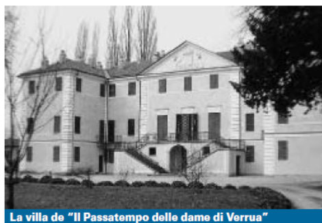
La villa de "Il Passatempo delle dame di Verrua"

Le dimore storiche e nobiliari di tutta Italia si aprono al grande pubblico, per un weekend di arte, cultura e tradizione. Oggi e domani, per la quinta edizione delle "Giornate Nazionali Adsi", residenze storiche, spesso inaccessibili ai visitatori, aprono i battenti con l'allestimento di mostre, aperitivi e attività culturali. Ovviamente, anche in Piemonte. In regione, saranno infatti diciotto i palazzi e i castelli, di cui sei nel torinese, visitabili gratuitamente. Si tratta di un'edizione che, oltre a valorizzare i beni culturali privati e la loro importanza per il patrimonio stori-