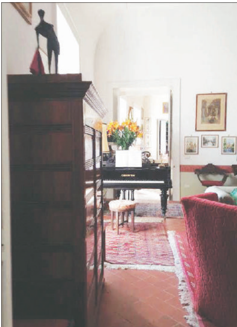
Palazzo Carratelli e gli interni della dimora