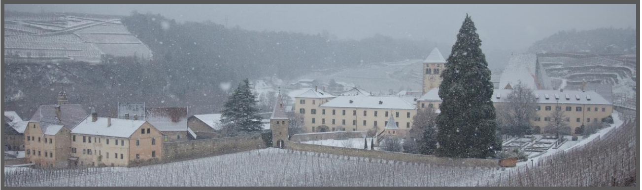
Abbazia di Novacella/Kloster Neustift

Associazione Dimore Storiche Italiane Sezione Trentino-Alto Adige / Südtirol