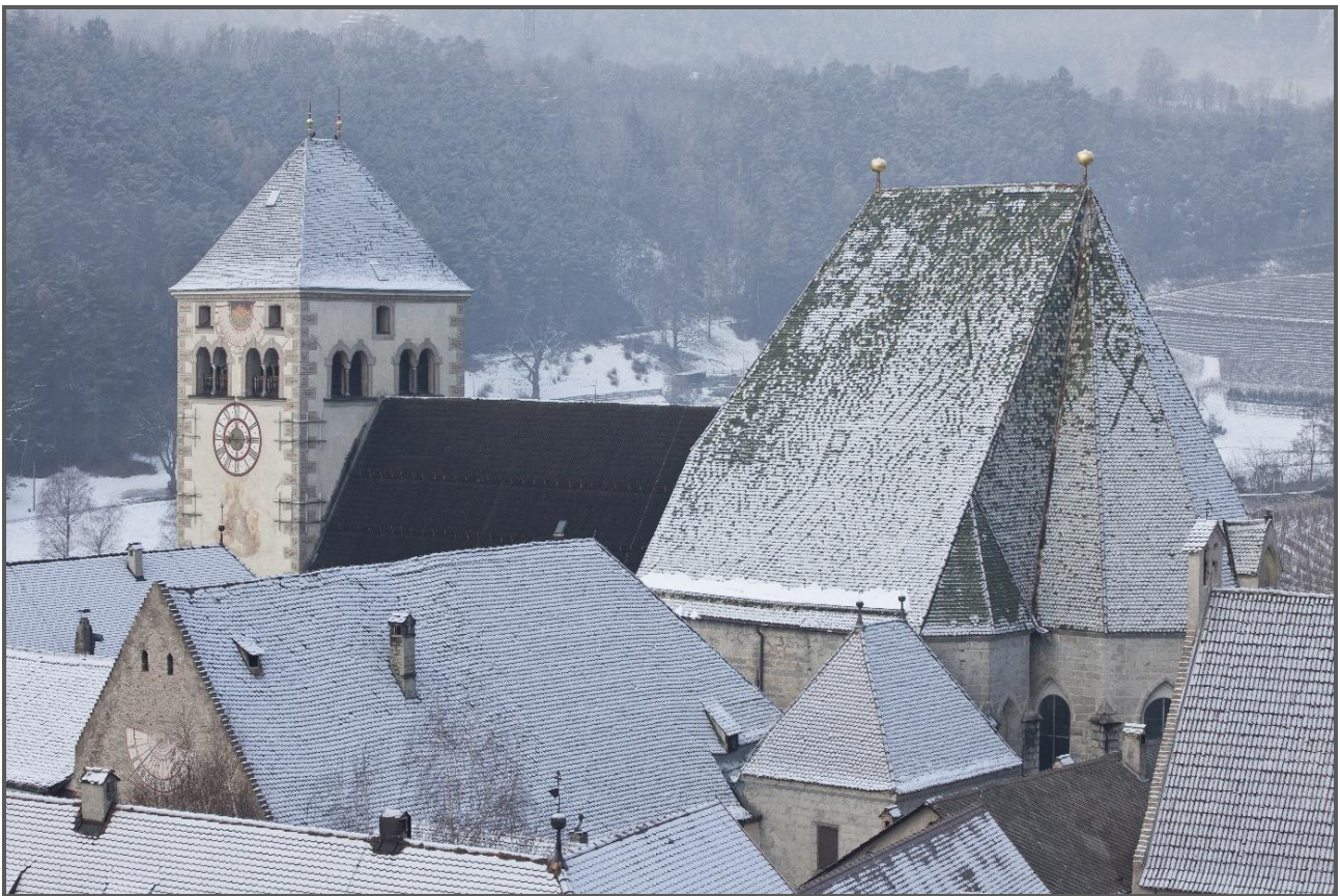
Veduta invernale della chiesa abbaziale con torre e navata del XIII secolo con l'imponente coro aggiunto nel XV secolo. Navata e coro sono stati barocchizzati nella prima metà del Settecento. In prima piano le coperture del chiostro gotico.