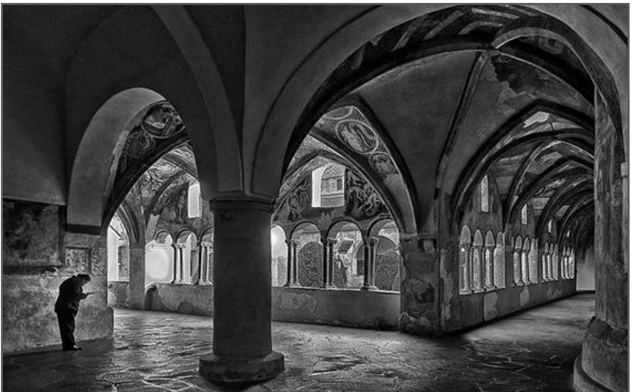
Chiostro di Bressanone

Il chiostro del Duomo di Bressanone è annoverato tra i monumenti artistici più significativi dell'Alto Adige. È famoso soprattutto per i mirabili affreschi di epoca gotica. La sua costruzione risale all'epoca preromanica, ma venne successivamente ristrutturato in stile romanico e gotico. L'intero complesso è, dunque, formato dal chiostro, dal Duomo di Bressanone, dalla Cappella di San Giovanni e dalla Chiesa della Madonna.