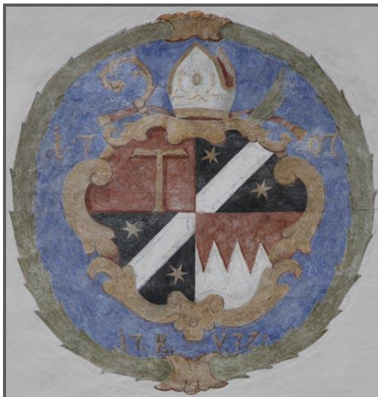
Stemma dell'Abbazia di Novacella/Kloster Neustift

P.S.: per favore, preannunciate la Vostra partecipazione per mail a trentino-altoadige@adsi.it o per telefono al numero 0039 335 545 7 580 (Wolfgang von Klebelsberg) entro il 21 dicembre 2017.