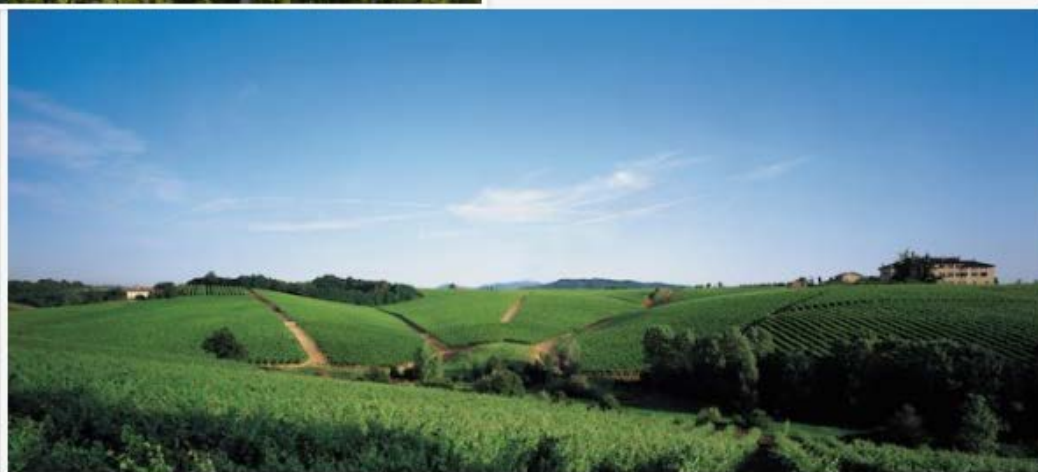
Tenuta La Marchesa

I soci ADSI sono proprietari di beni culturali vincolati come monumento nazionale che, nel caso delle tenute viticole, comprendono, oltre alle cantine, giardini, vigneti, oliveti e boschi, in un insieme di straordinaria bellezza al tempo stesso architettonica e paesaggistica.