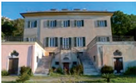
Villa Spinola Grillo Genova Voltri