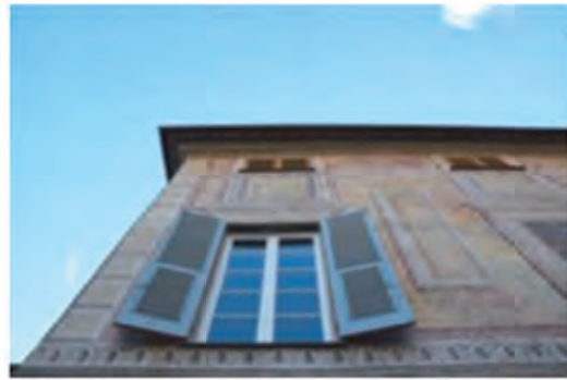
Villa Spinola Dufour Genova Cornigliano