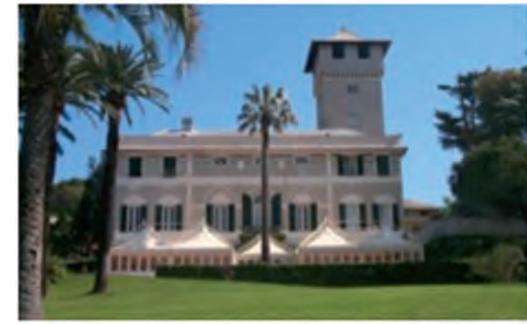
Villa Doria d'Albertis Genova Quarto