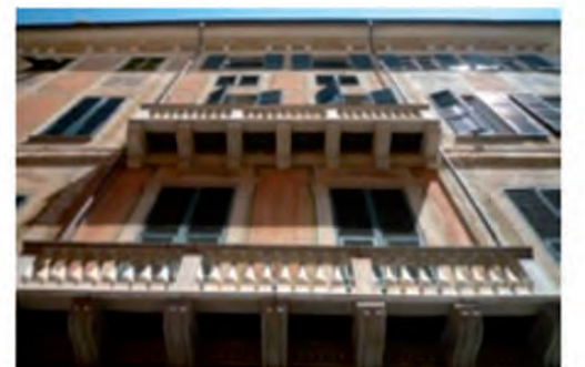
Palazzo Ravaschieri Chiavari