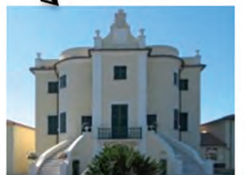
Villa Pratola Santo Stefano Magra