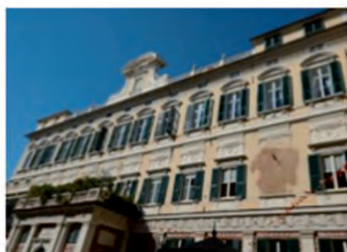
Palazzo Grimaldi della Meridiana Genova centro