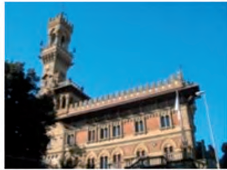
Castello MacKenzie Genova centro